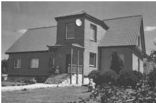
11. Двухэтажно-мансардный дом из цилиндрованных бревен в селе Преображеновка Липецкой области