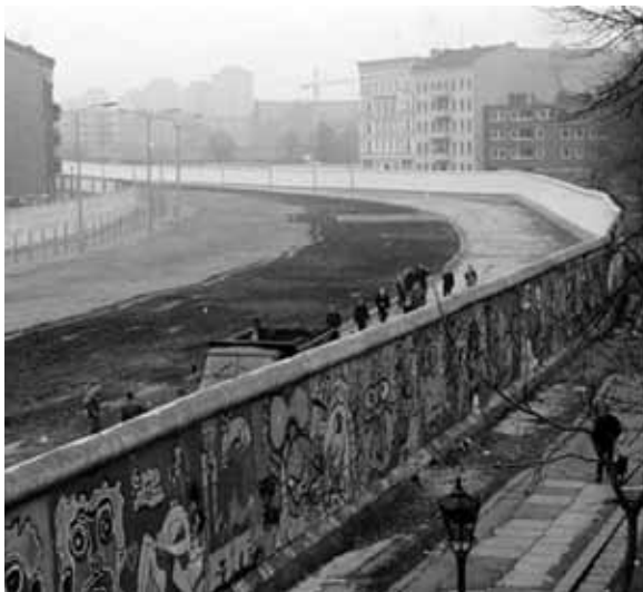
4. Вид с обзорной вышки на сохраненную часть комплекса