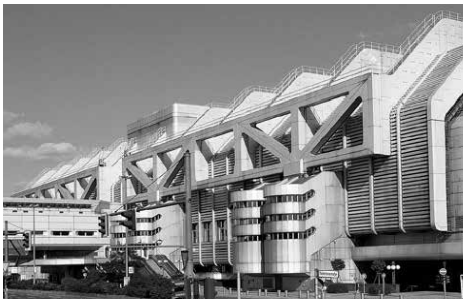
6. Международный конгресс-центр — ИСС, арх. Р. Шулер и У. Шулер-Витте.